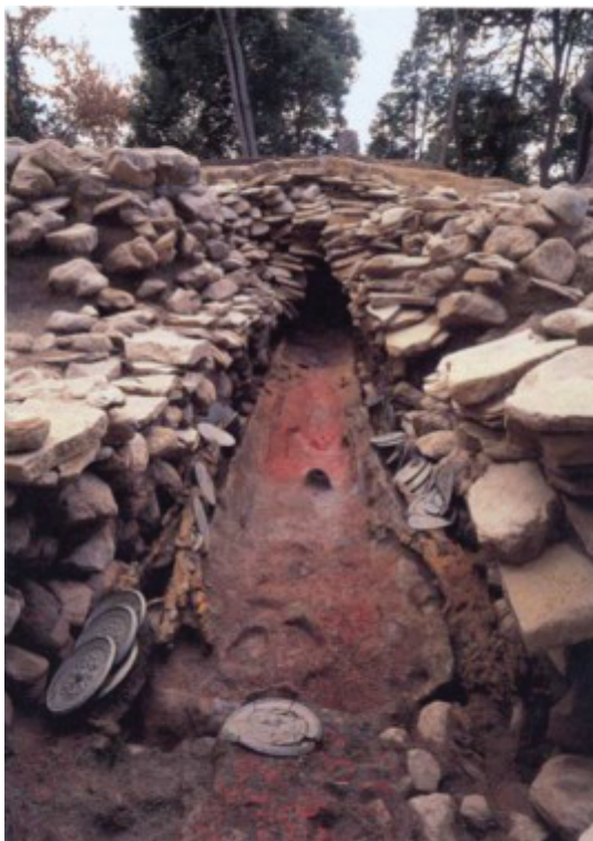
Фотография № 9

Как указывалось, в Японии, как в Китае и Корее, бронзовые зеркала служили в качестве сопроводительного (погребального) инвентаря (см. фотографию № 9).