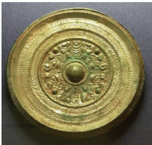
Илл. 2. Зеркало с треугольной кромкой и изображениями небожителей и животных. Музей древностей Сэньюку 泉屋博古館, г. Киото.