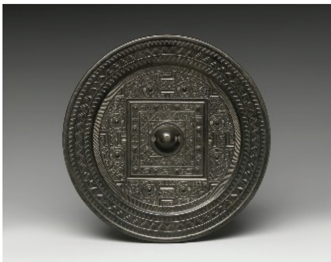
Фотография № 8

四神鏡 нашёл отражение космологический концепт 四神 кит. сышиэнь , который широко представлен в китайской культуре и рано проник в Японию; он означает четырёх мифических животных – божеств-покровителей четырёх сторон света: Юг – Красная птица 朱雀 яп. судзаку / сюдзяку , Север – Чёрная черепаха (букв. «Темный воин») 玄武 яп. гэмбу , Восток – Голубой (лазоревого) дракон 青龍 яп. сэйрю , Запад – Белый тигр 白虎 яп. бякко (см. фотографию № 8).