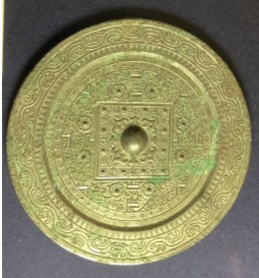
Илл. 3. Зеркало с большим квадратом в центре и орнаментом в форме букв TLV. Музей древностей Сэньоку 泉屋博古館, г. Киото.