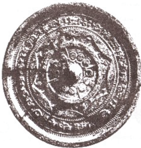
Илл. 1. Зеркало с орнаментом «внутренний цветок», найдено в Чжэнчжоу 鄭州, пров. Хэнань 河南 (Китай). 1