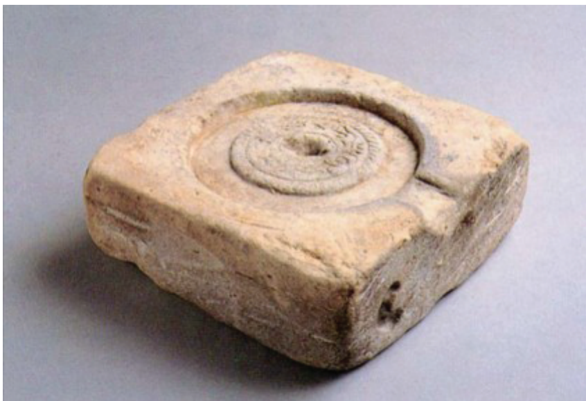
Фотография № 3

Литейная форма для малоформатных японских бронзовых зеркал-подражаний ( бōсэйкё 仿製鏡) и для каплевидных бусин магатама