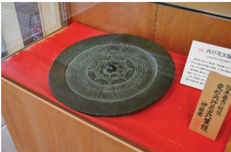
Фотография № 6

тех же литейных формах, что и т. н. «зеркало Ята» 八咫鏡 (яп. ята-но кагами ) 1 – важнейшая из трёх регалий императорской династии Японии, которая хранится в святилище Исэ.