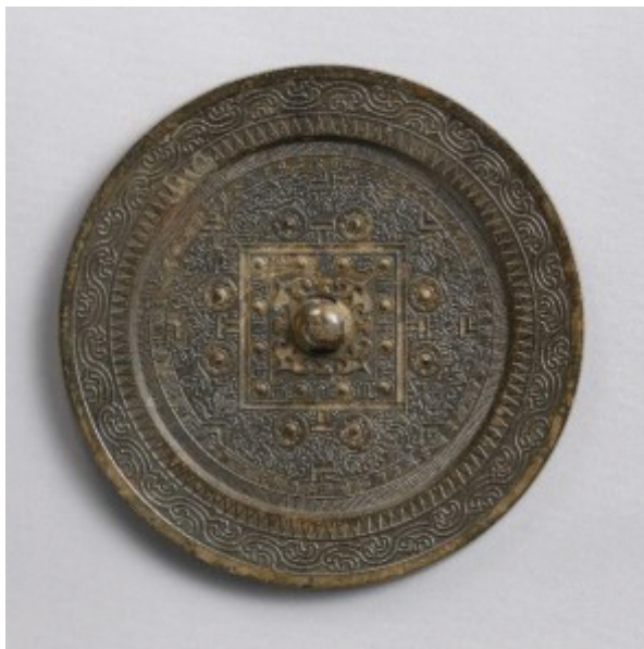
Фотография № 5

ней Хань государств правителю На была дарована золотая печать 1 с иероглифической надписью「漢委奴國王」, которую традиционно переводят как «Царь страны Ну из Во, [подданный] Хань». Д.А. Суровень приводит современный вариант перевода этой надписи 「漢委奴國王」: «[Император] Хань назначает на должность правителя государства Ну (яп. На)» 2 , который ещё больше подчёркивает специфический характер взаимоотношений японских политий периода яёй с раннеимперским Китаем.