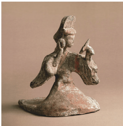
Фотография № 1

Керамическая фигурка женщины с бронзовым зеркалом и пуховкой (Китай, Ранняя Хань, 206 г. до н.э. – 8 г. н.э.)