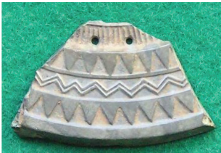
Фотография № 4

наряду с инвеститурой власти получали различные китайские изделия высокого качества (напр., ткани и др.); бронзовые зеркала были самыми ценными среди таких престижных изделий. Правители этих «малых государств», в свою очередь, наделяли такими символами статуса, престижа и власти подвластных им или зависимых от них вождей более низкого ранга и представителей элиты; по мнению исследователей, бронзовыми зеркалами (или их фрагментами) обменивались при заключении политических союзов 1 (см. фотографию № 4).