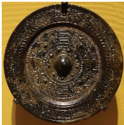
Фотография № 2

Керамическая фигурка женщины с бронзовым зеркалом и пуховкой (Китай, Ранняя Хань, 206 г. до н.э. – 8 г. н.э.)